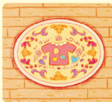
ゆかシート …1枚 Floor Sheet

ゆかシートは、スナップフレーム③の うしろにセットされています。 The floor sheet is on the back of Snap Frame 3.