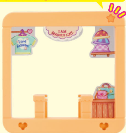
スナップフレーム① …1個 Snap Frame 1

スナップフレーム①はこの☆が1つだよ! Snap Frame 1 got one star in here!