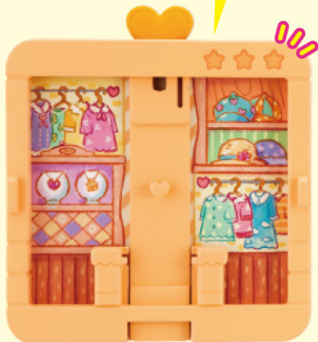
スナップフレーム③ …1個 Snap Frame 3

スナップフレーム③はこの☆が3つだよ! Snap Frame 1 got three stars in here!