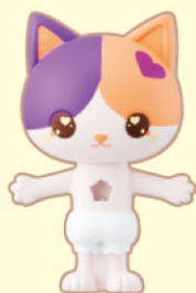
ドール(マーブルねこ) …1体 Doll (Marble Cat)

●画像はイメージです。 Product images are for illustration purpose only.