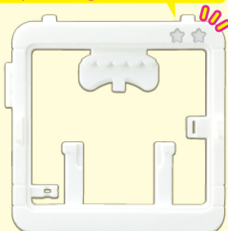
スナップフレーム② …1個 Snap Frame 2

スナップフレーム②はこの☆が2つだよ! Snap Frame 2 got two stars in here!