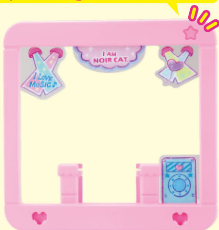
スナップフレーム① ...1個 Snap Frame 1

スナップフレーム①はこここの☆が1つだよ! Snap Frame 1 got one star in here!