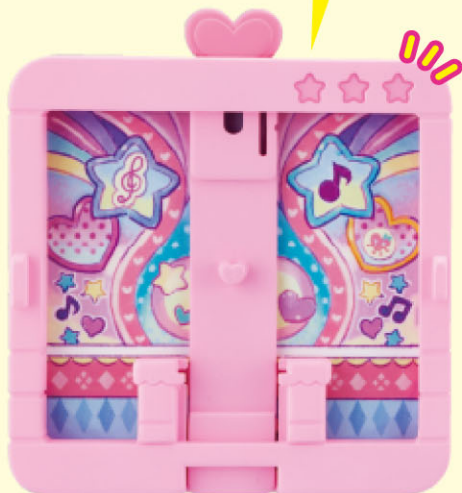
スナップフレーム③ ...1個 Snap Frame 3

スナップフレーム③はこここの☆が3つだよ! Snap Frame 1 got three stars in here!