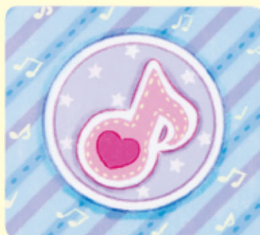
ゆかシート ...1枚 Floor Sheet

ゆかシートは、スナップフレーム③の うしろにセットされています。 The floor sheet is on the back of Snap Frame 3.