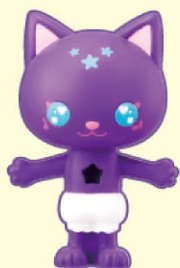
ドール (ノワールねこ) ...1体 Doll (Noir Cat)

●画像はイメージです。 Product images are for illustration purpose only.